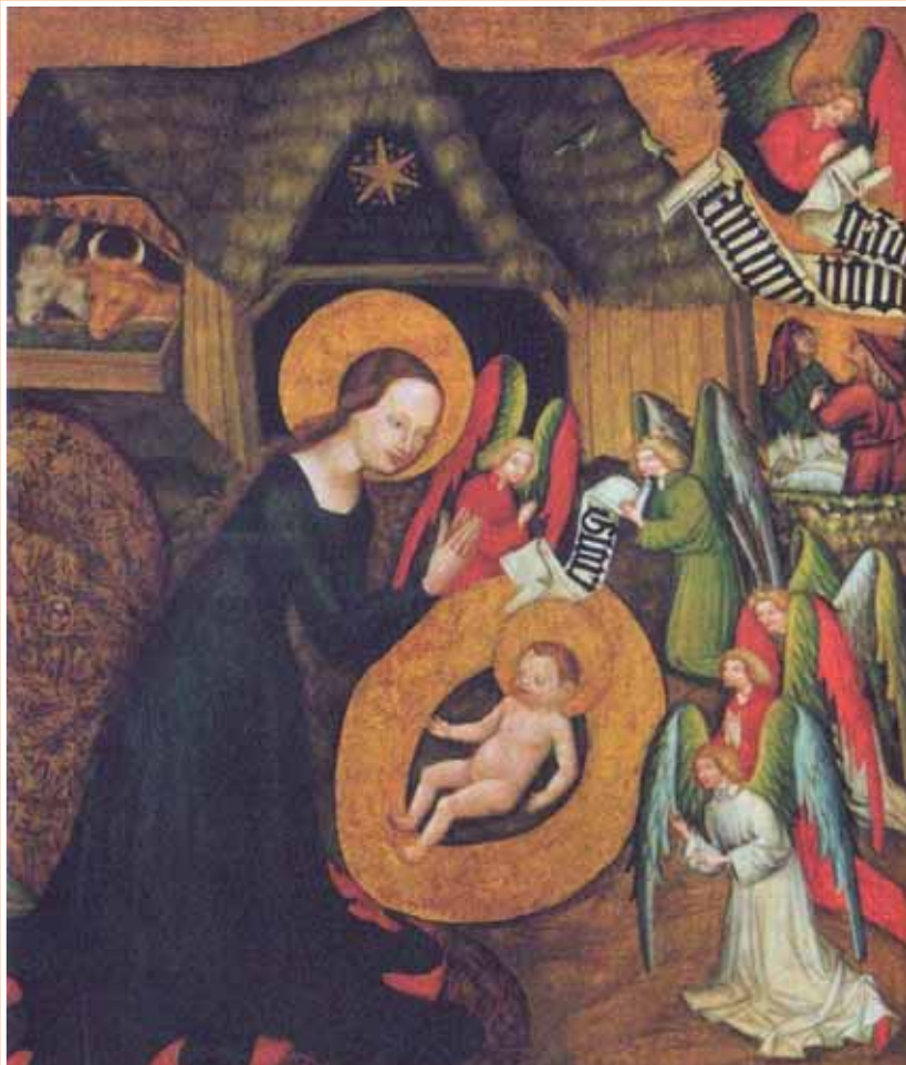
Christi Geburt, Meister von Großraigern, um 1420, Kunsthistorisches Museum, Wien.